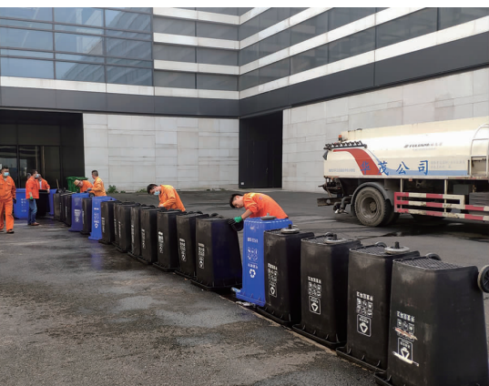
9月10日，中国人民解放军某部7000余人在连云港开发区工业展览中心驻扎，进行为期三天的军事演练，华茂瑞泰服务公司扎实推进“两在两同”建新功行动，组织党员突击队做好后勤垃圾清运工作，展现企业担当和形象。(许月飞)