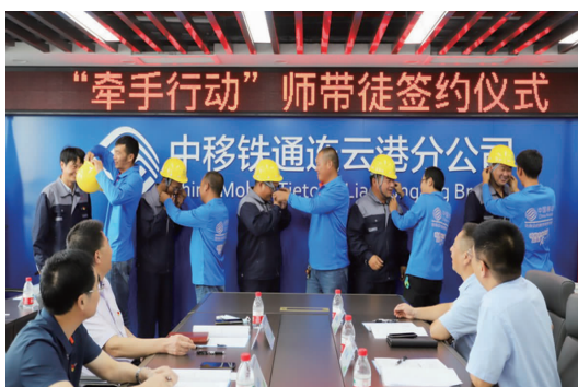
日前，台北投资公司党委与中移铁通连云港分公司党支部举行“党建和创”师带徒“牵手行动”签约仪式，筛选出的5对师徒分批走上签约席，郑重签下“牵手行动”师徒结对协议，薪火相传从此启航，助力企业高质量发展。(李静娴)