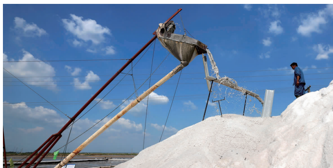
9月18日14时28分，方洋二组机器轰鸣，银瀑飞溅，徐圩投资公司全面吹响“秋扒会战”冲锋号，马二份工区工作人员勠力同心，抢抓当前晴好天时忙碌在盐田里，严格按照“三不放过”、人工活碴、“六斗宽”等制度监督考核，为确保完成全年秋扒目标任务携手奋战。(刘永)