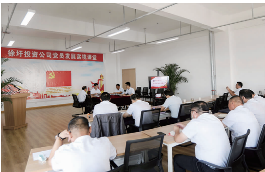
9月18日上午，徐圩投资公司党委创新“实境党课”新载体，以规范发展党员工作程序为主题召开支部大会观摩交流会，活动以“话剧”形式真实再现各支部在发展党员过程中如何规范做好“5个阶段”工作，并就发展党员“5个阶段”“39张表格”如何规范填写进行交流互动。(陈健)