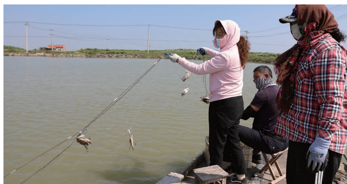
中秋节期间，又到了一年一度梭子蟹收获的季节，青口投资公司三洋分场养殖户正在忙于起捕梭子蟹。据了解，今年的大闸蟹由于产量问题，价格比往年有所提升，每斤价格在50元至80元不等，但市民们尝鲜的热情却一如既往地高涨。(尤冬冬)

优化工艺，提升生产效率。根据设备运行状况，对色选机、全自动包装机、食盐质量追溯系统等工艺进行优化，提高设备包装生产效率，降低物耗成本；增加对各类盐产品的化验检测频次，汇总分析生产数据，适时调节生产运行参数，提升产品质量，跟踪小包装盐产品动态称重系统，确保稳定运行，降低损耗；优化原料盐化卤及卤水净化工艺，提升盐产品透光率；增加盐产品洗涤卤水检测频次，提高盐产品白度；根据不同品种生产、入库要求，合理调节大、小包装ABB码垛机器人码垛运行参数，降低生产运行电耗，提升库房周转效率。(金宣)