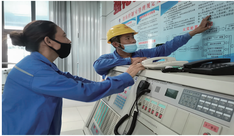
近年来,利海化工公司建立“点面结合、量体裁衣”培训长效机制,科学制订年度培训 237 项,截止目前,完成内培外训 152 项,员工参训 2600 余人次。图为消防实操培训现场。(顾孟 梁娟)

赠送一批廉政读本。向广大中层管理人员赠送廉政读本《清风传家》《严以治家》,用好家风建设正反典型读物,教育引导党员干部严格家教家风,严格管好、管住家属子女,自觉摆正党性与亲情、家风与党风的关系,带头树立良好家风,切实掌好权、用好权。(北纪)